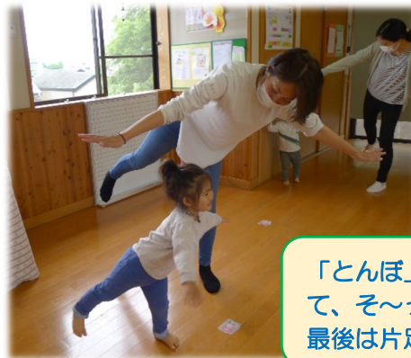
「とんぼ」は手をピンと横にのばして、そ〜っとつまさきで走ります！ 最後は片足で止まってポーズ！

後半の、2階全体を使った「サーキットあそび」も好評です。ゆうびん屋さん、トランポリン、すべり台、トンネル、鉄棒、いっぽん橋など、楽しかったね！