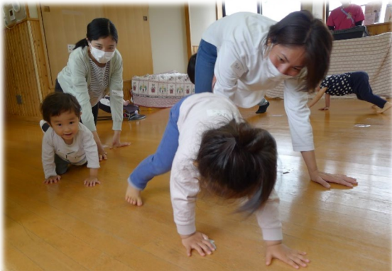
「おうま」は手先、足先をしっかりつけます