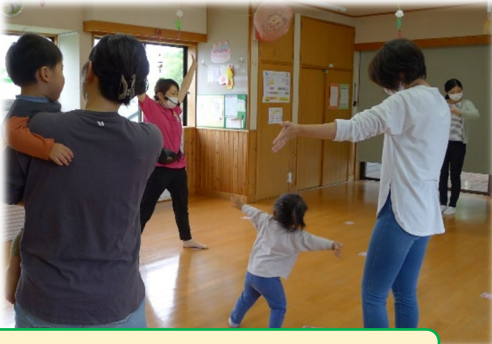
まずはサンサン体操で準備運動

令和6年5月16日(木) 10時～12時 参加：子ども5名(うち妹1名) 大人4名 「リズムあそびとサーキットあそび」