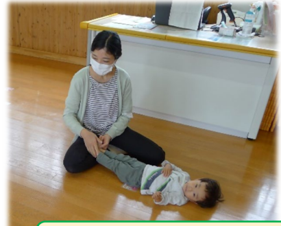
「きんぎょ」は、脱力してゆらゆら♪